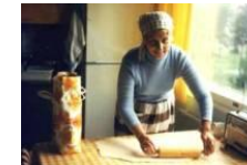
Lasipalatsin mediakeskus: Fotorally Euroslam