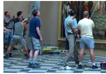
VTM / KEHYS: Collections Mobility 2.0