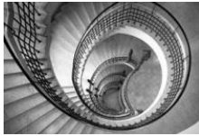
Helsingin kaupungin- museo: Art Nouveau & Ecology