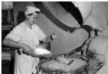
Työväenmuseo Werstas: A Taste of Europe