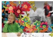
Oulun kaupunginteatteri: Platform 11+