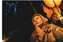
Baltic Circle: Festival Lab