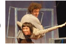
Annantalo: Small size, big citizens