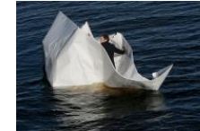
ANTI-festivaali: A Space for Live Art