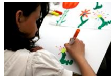
Designmuseo: Fantasy Design