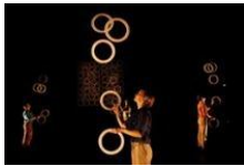
Sirkuksen tiedotus- keskus: CasCas