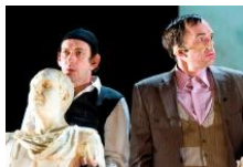
Tutkivan teatterityön keskus: Prospero