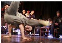
Turku 2011 -säätio: Eurocultured