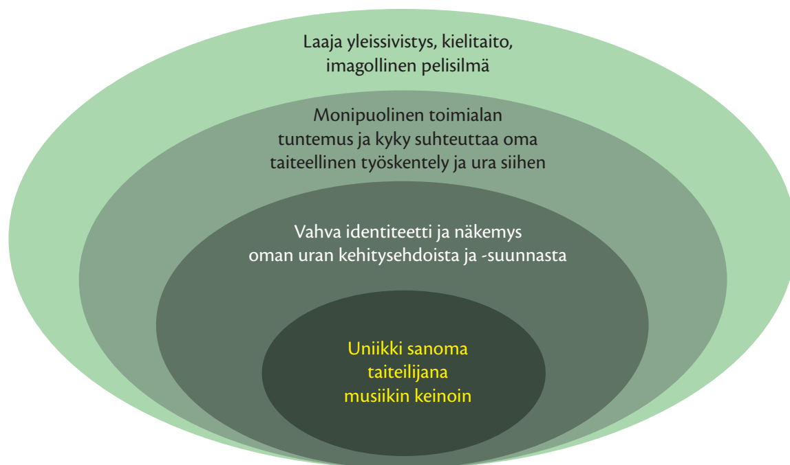
KUVA 2. Muusikon osaamisen eri ulottuvuudet kehinä

Keskiössä oleva persoonallisen taiteilijuuden alue sisältää instrumenttihakinnan ohella myös taidon kommunikoida yleisölle. Kommunikaation ensisijainen reitti on musiikki: teoksen tulkinnassa pitää olla jokin omasta taiteilijuudesta kumpuava sanoma, jonka taiteilija haluaa välittää yleisölleen.